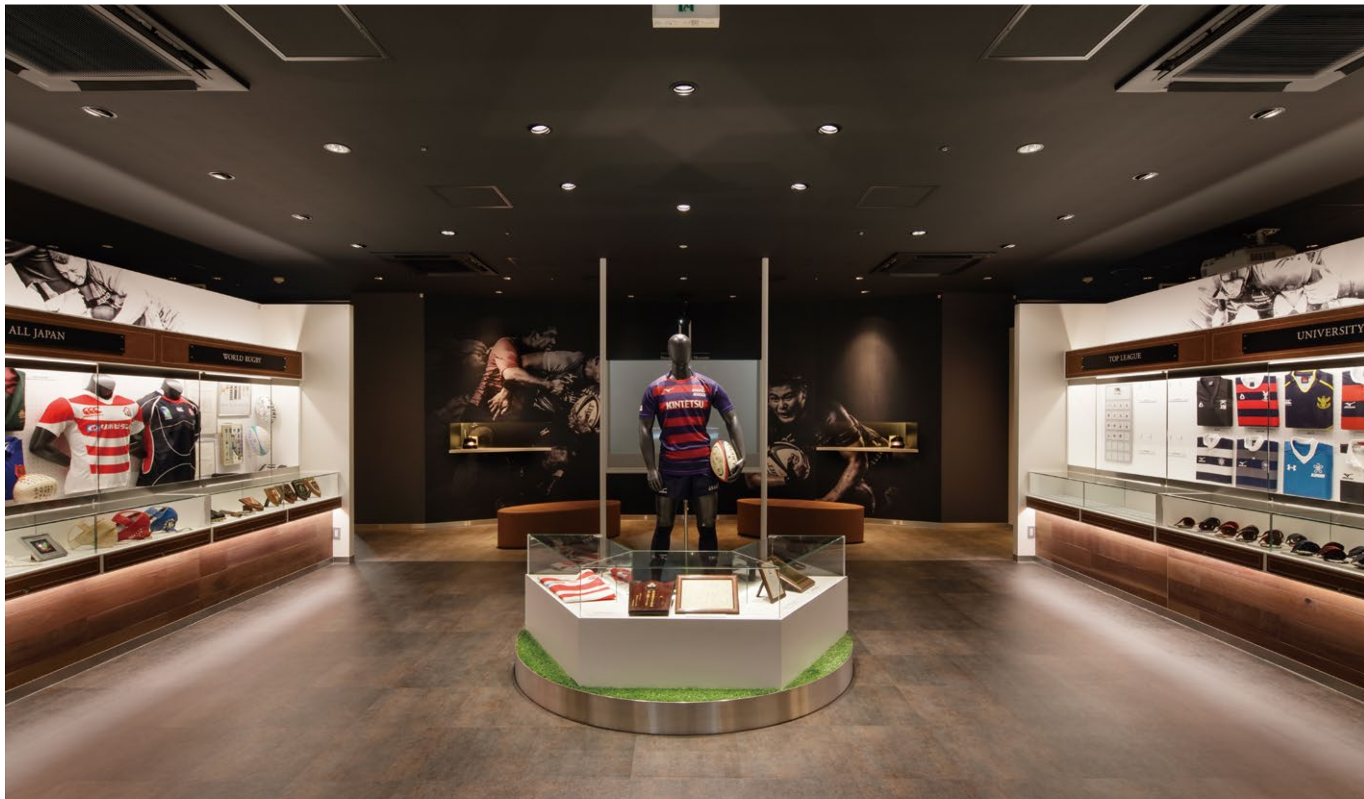
展示室中央エリアを見る