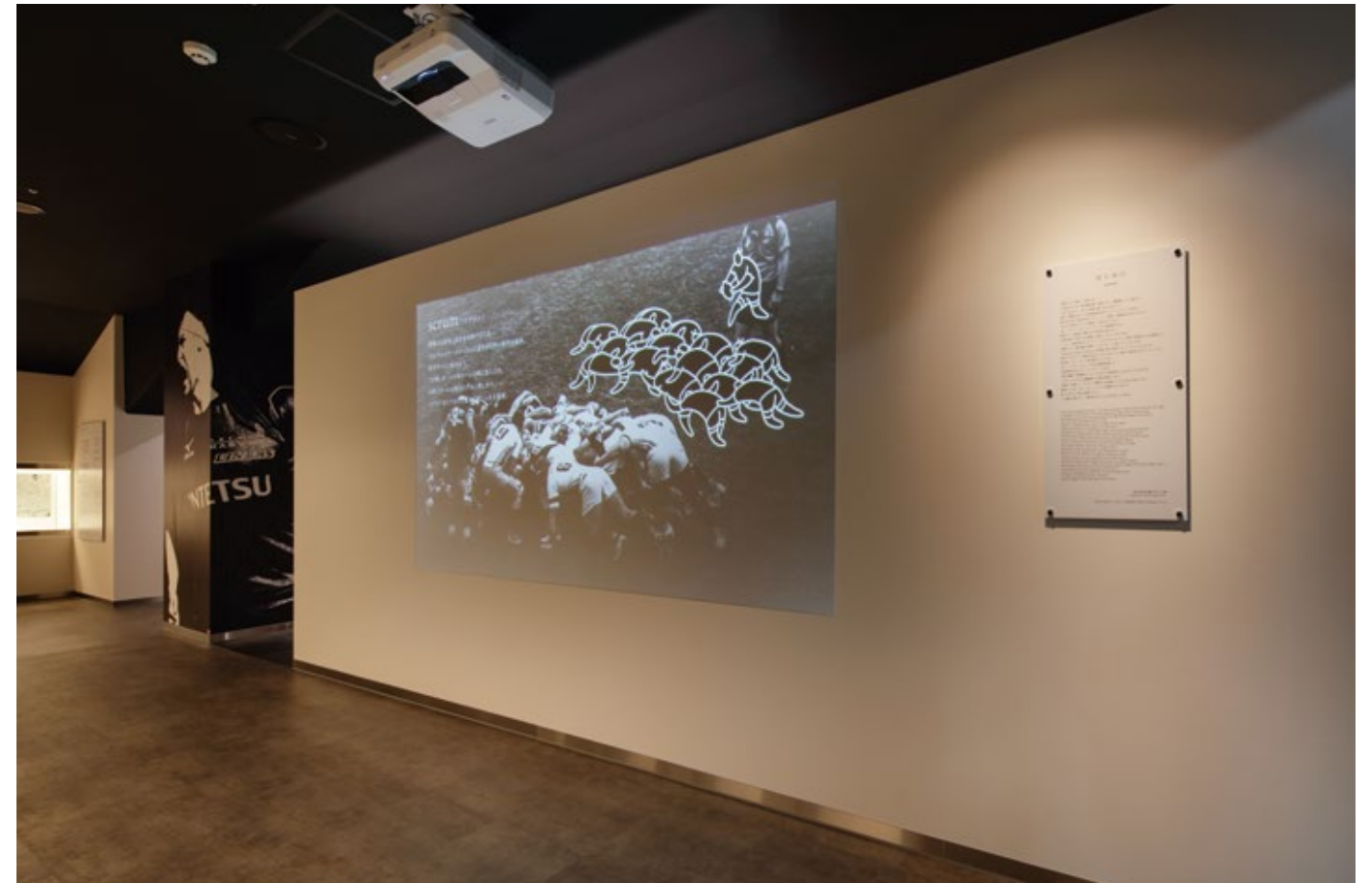
エントランスからプレイ解説映像を見る