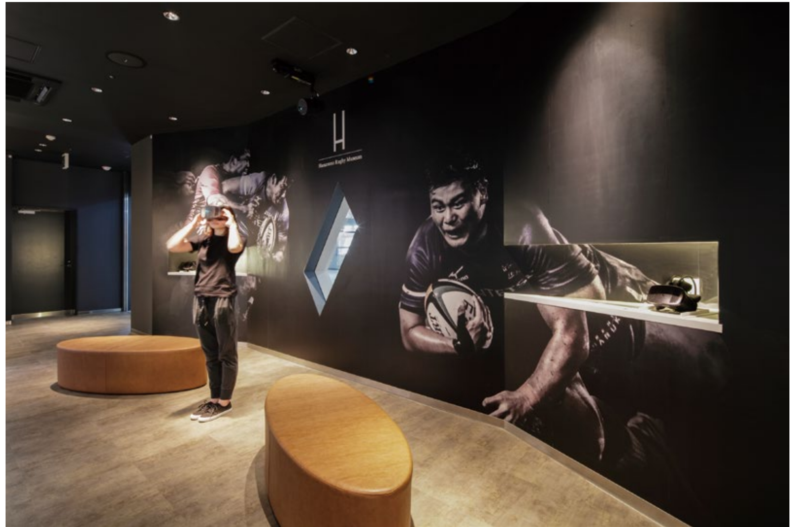
仮想ラグビー体感映像エリアを見る