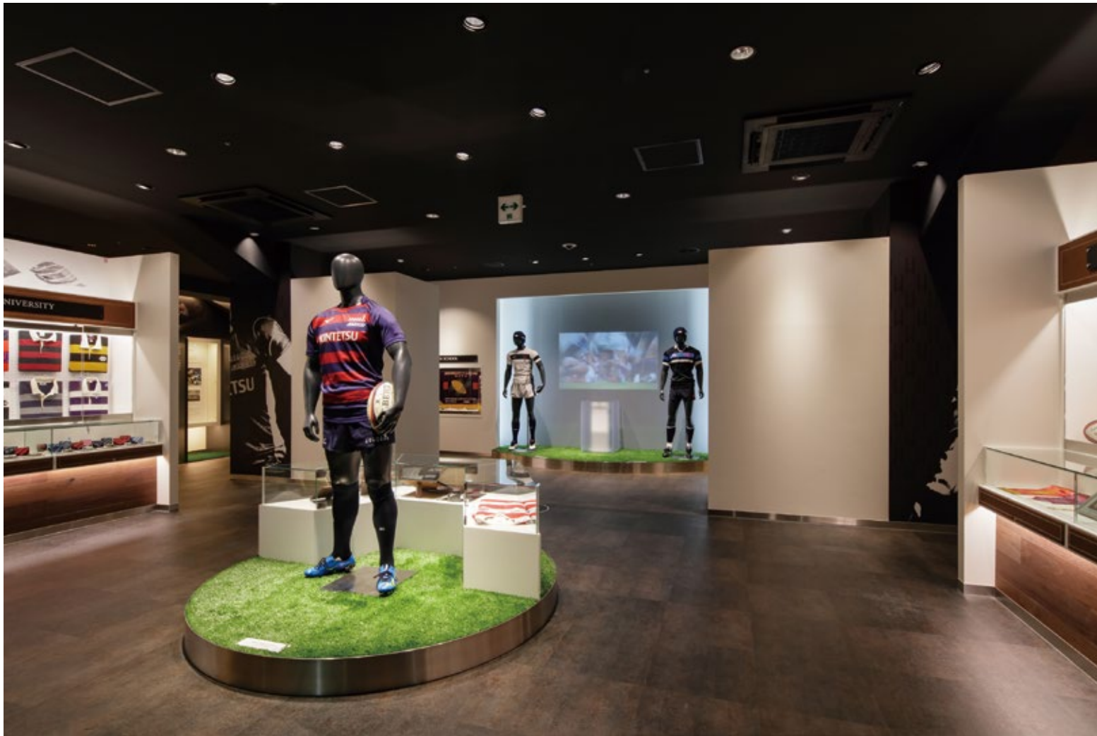
展示室中央エリアを見る